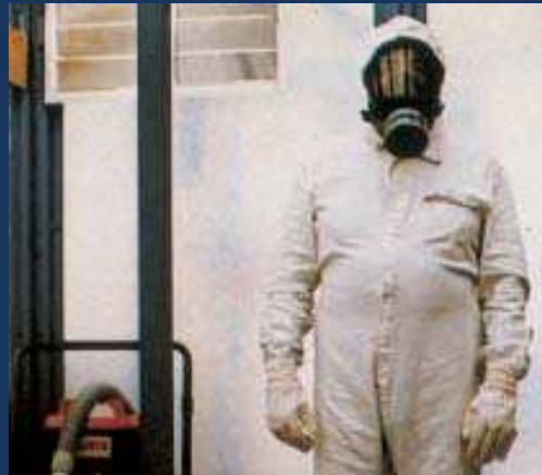
MASCHERA A PIENO FACCIALE FILTRO P3